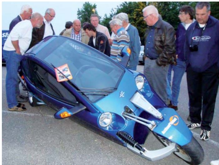
Dat zie je niet iedere dag. In totaal produceerde Carver maar zo’n 200 auto’s. Zes daarvan zijn van verhuurder Action Planet in Halfweg.

De grafiek kleurt al aardig groen, maar bij lage snelheid zit nog een verticale rode baan: “Tot 8 km/u staat het voertuig gelocked. Daarboven wil je niet ineens volledig kantelen. Daarom schakelen we de lockfunctie geleidelijk uit. Pas vanaf 24 km/u haalt het voertuig de maximale kantelhoek”.