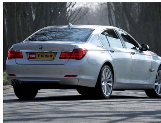
Een beschaafde achterkant met enorme, karakteristieke achterlichten.

De krachtige diesel is dankzij EfficientDynamics dusdanig schoon dat hij in ons land met het C-label wordt verkocht. Onze testauto noteerde een keurig verbruik van 9,4 liter op 100 km. En daarvoor hoefden we niet eens met een fluwelen voetje te rijden.