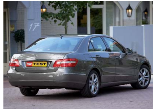
Is dit een Mercedes? De bekende Mercedes-ster maakt aan de verwarring een einde.

Wanneer een dusdanig dure auto als deze E 250 CDI met een viercilinder is uitgerust en van Mercedes dan ook nog de 'oude' vijftraps-automat mee krijgt, (de zeventraps is er alleen vanaf de zescilinders) begin je enigszins sceptisch aan de eerste rit. Je verwacht een brommende diesel en een matig toerenverloop. Maar dat blijkt een grote vergissing. Want bij deze Mercedes hoor en voel je al vanaf de eerste meters de grote klasse van een geweldige motor. Bij een rustige rijstijl zijn de mechanische geluiden verwaarloosbaar, ga je even op het gas staan dan hoor je een diepe maar lekker melodieuze grom. Bij hogere toeren en toenemende snelheid dringt er nog steeds maar weinig motorgeluid in de cabine door en nemen het windgeruis en de licht hoorbare bandenroffel